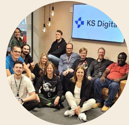
Forberede selskapet på nye områder