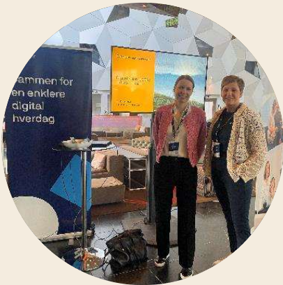
Videreutvikle evne og kapasitet